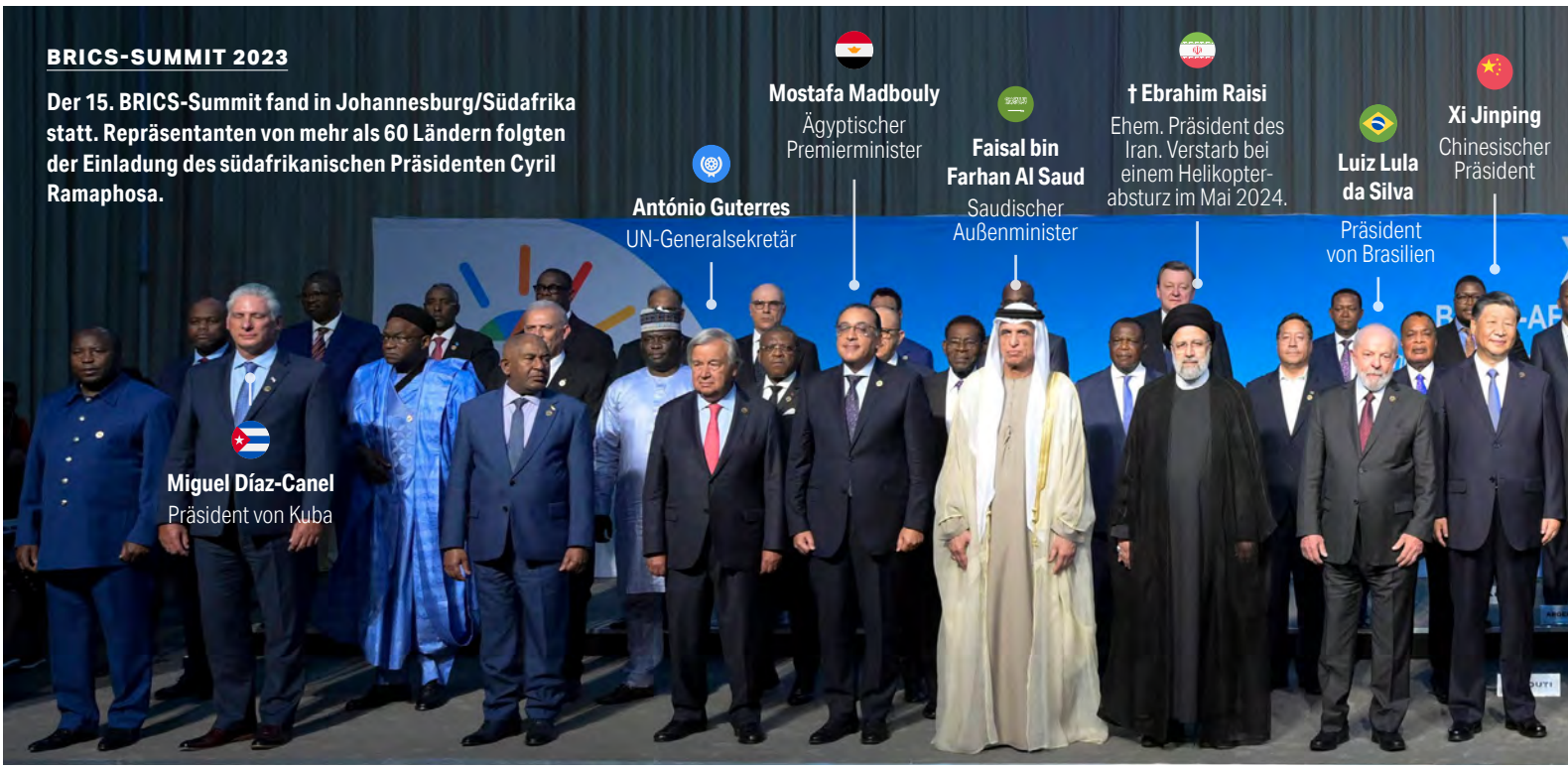
Miguel Díaz-Canel Präsident von Kuba

Der 15. BRICS-Summit fand in Johannesburg/Südafrika statt. Repräsentanten von mehr als 60 Ländern folgten der Einladung des südafrikanischen Präsidenten Cyril Ramaphosa.